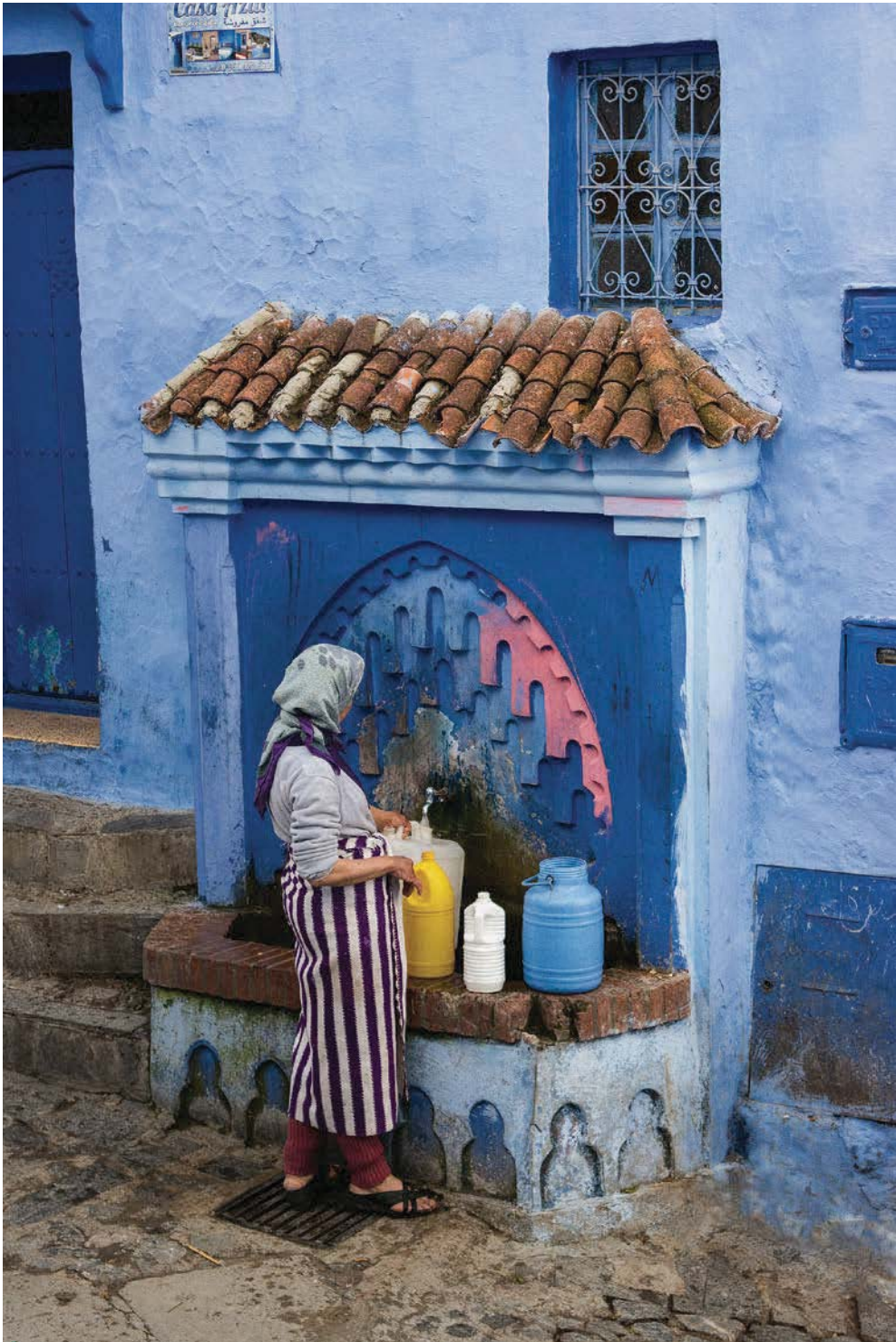
© Enrique Soto, Marruecos, Chefchaouen, 2014.