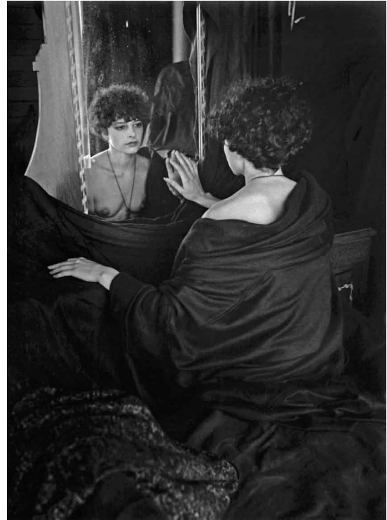
© Ricardo Vinós, Toca la puerta de la punta de los dedos... Coyoacán, 1986.

circunstancia fue tomada la idea ajena. Para ser completamente claros: el plagio se considera como el hurto del trabajo intelectual de otra persona. Entre las múltiples causas por las cuales los estudiantes cometen este error puede identificarse el creer que las ideas “son de todo el mundo” así como una inadecuada y pobre metodología para saber citar.