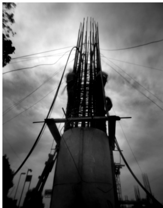
de la serie Ciudad desierta , 2003.

ingestión o a la inyección de 10 mg de psilocybina son: midriasis, congestión facial, modificaciones variables del pulso y de la tensión arterial, hiperreflexia tendinosa, manifestaciones somáticas subjetivas y profundas modificaciones de la actividad eléctrica cerebral. La psilocybina puede provocar una psicosis artificial con alteraciones de la apreciación de la realidad y reducción de la capacidad de juicio. Aproximadamente a los 45 minutos de haber ingerido de 4 a 8 mg de psilocybina, se produce un estado de alucinación caracterizado por el relajamiento corporal y la pesadez de las extremidades, que se alterna con una mayor o menor atención hacia el mundo exterior e interior, desaparecen las inhibiciones y se recuerdan vívidamente hechos aparentemente olvidados.