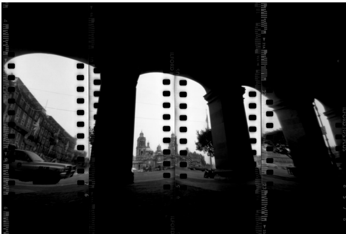
© César Flores, de la serie Ciudad desierta , 2003.

gas. Los faraones del antiguo Egipto tenían tal estima por los hongos que convirtieron su consumo en privilegio exclusivo de la clase dirigente; para los caldeos eran manjares delicados, en tanto que los chinos e hindúes aprendieron a desecarlos y preservarlos en forma de polvo. En muchos países de Asia se empleaban los hongos como droga medicinal para combatir diferentes males. En celta se denomina al hongo como “hijo de una noche”. Un druida de la Galia describe reverentemente cómo un hongo sagrado que creció hasta alcanzar la altura de 30 cm, iluminó el bosque con una luz dorada. Los hongos fosforescentes modernos incluyen al “fuego fatuo” ( Pleurotus olearius ) y a una especie australiana de la cual se desprende una luz verde tan intensa que, se dice, se puede leer con ella. Los antiguos griegos consideraban a los hongos como alimento de dioses. Juvenal pone en boca de un sibarita esta rapsodia: “guarda tu maíz, ¡Oh Libia!, desata tus bueyes, siempre que nos envíes hongos”. Éstos eran clasificados y vendidos según leyes estrictas y preparados en utensilios especiales. La muy difundida creencia de que los hongos brotan en una noche parece provenir de una antigua leyenda que se