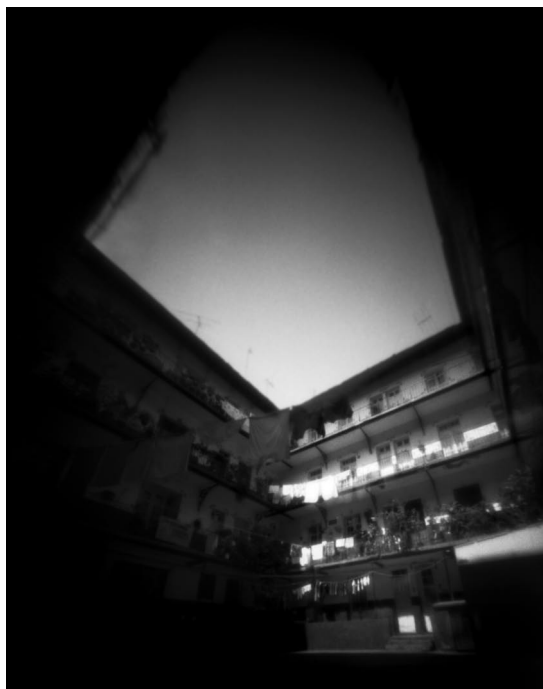
© César Flores, de la serie Ciudad desierta , 2003.

En 1958, Albert Hoffman obtuvo de los esclerotes de Psilocybe mexicana , dos compuestos químicos de acción psicotrópica que denominó psilocybina y psilocina. Ulteriormente fueron descubiertos estos compuestos en otras variedades de Psilocybes y en la Stropharia cubensis . Estas sustancias aisladas son drogas neurodislépticas de naturaleza indólica. La farmacología animal muestra que se trata de sustancias de acción estimulante neuro-vegetativa compleja, con importantes efectos sobre el sistema nervioso central. En el humano la psilocybina moviliza la serotonina aumentando considerablemente la excreción urinaria de sus productos de degradación. Las reacciones fisiológicas a la