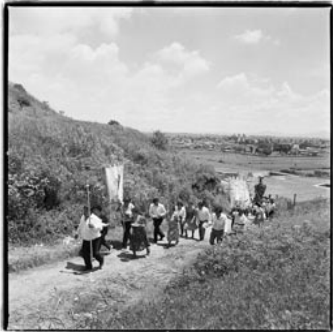
© John O'Leary, Barrio de Santa María Xixitla, Cholula, Puebla, 1994.

Además, los códices narran que el pulque de los dioses fue donado a los hombres por la mediación del tlacuache. 10 Como ya lo mencioné con anterioridad, en el valle Puebla-Tlaxcala se detecta un culto temprano al tejón (o a un animal similar, quizá un tlacuache), cuyos rituales vinculados a la tierra y a los ciclos agrícolas parecen ser muy antiguos en la región. 11 Kirchoff además nota