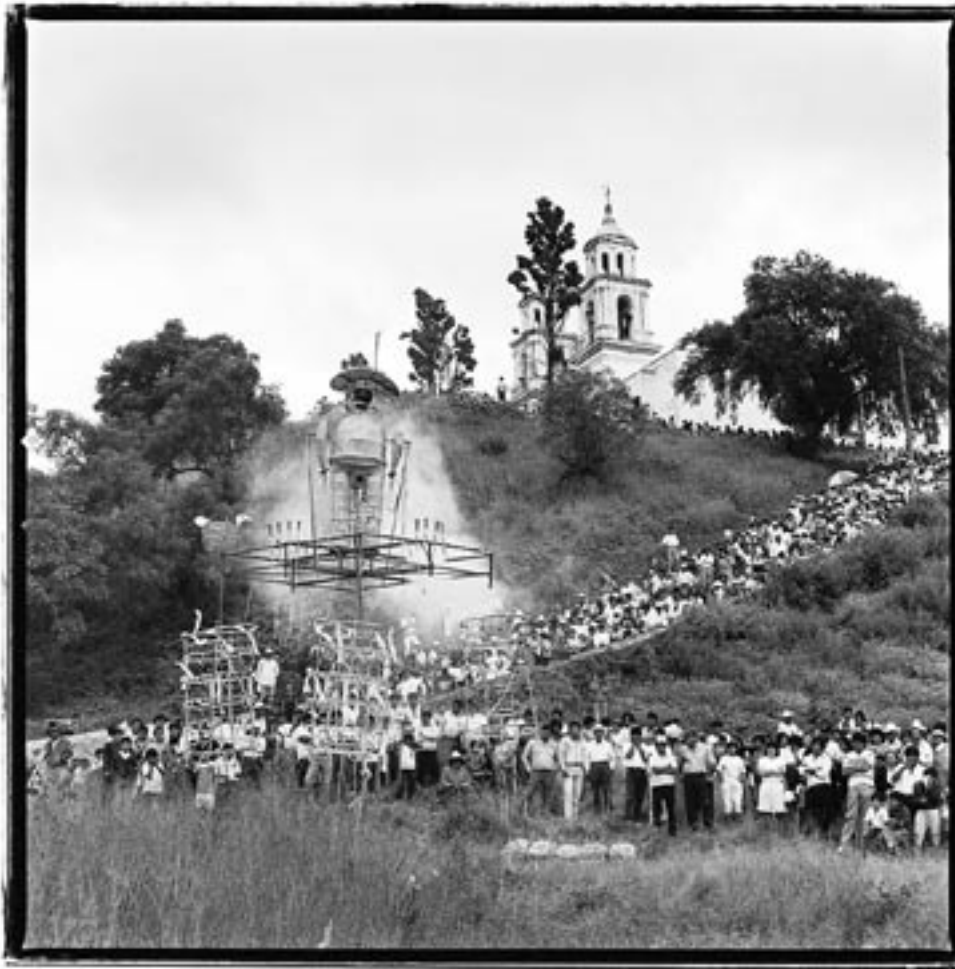
© John O'Leary, Barrio de Santa María Xixtla, Cholula, Puebla, 1993.

El crecimiento acelerado de la capital del estado, y una conurbación sin regulaciones en el territorio circundante amenazan con destruir los últimos reductos vírgenes de basamentos arqueológicos que podrían permitirnos conocer las condiciones específicas del desarrollo histórico de Cholula entre 500-1000 d.C.: sobre el parcialmente explorado cerro Zapotecas (con el enorme basamento oval-circular de su juego de pelota), donde pervivió la población cholulteca el periodo de la decadencia teotihuacana, 30 las actuales autoridades municipales y estatales promueven hoy la urbanización. 31