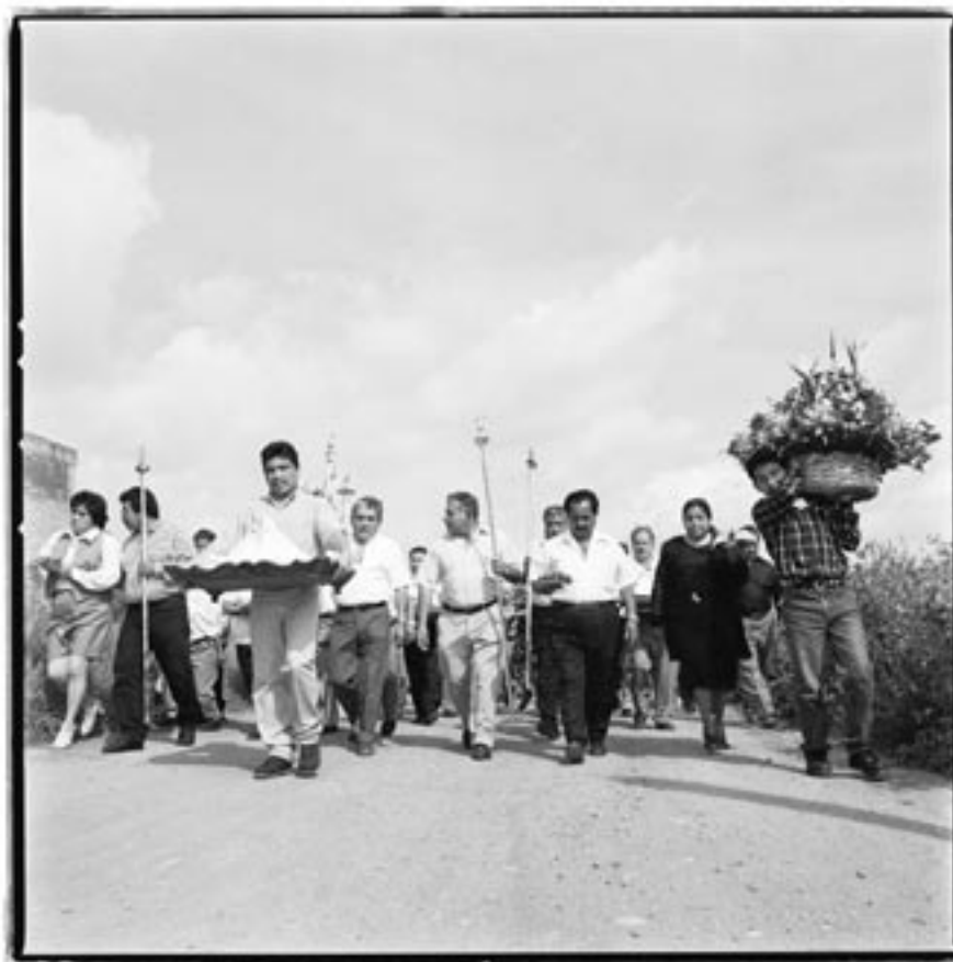
© John O'Leary, Barrio de San Miguel Tianguisnahuac, Cholula, Puebla, 1999.

tutelares, y de ejercer inmersa en el contexto de un gobierno, como dice López Austin, a su vez supra-étnico. 7 El Aquiach Amapame –quien residía en el Tlachihualtepetl– sustentó probablemente su autoridad en su identificación con el dios de la lluvia (la ancestral y cambiante deidad mesoamericana) y, como consecuencia, debió fungir como gobernante-sacerdote territorial del hueyaltepetl cholulteca. 8