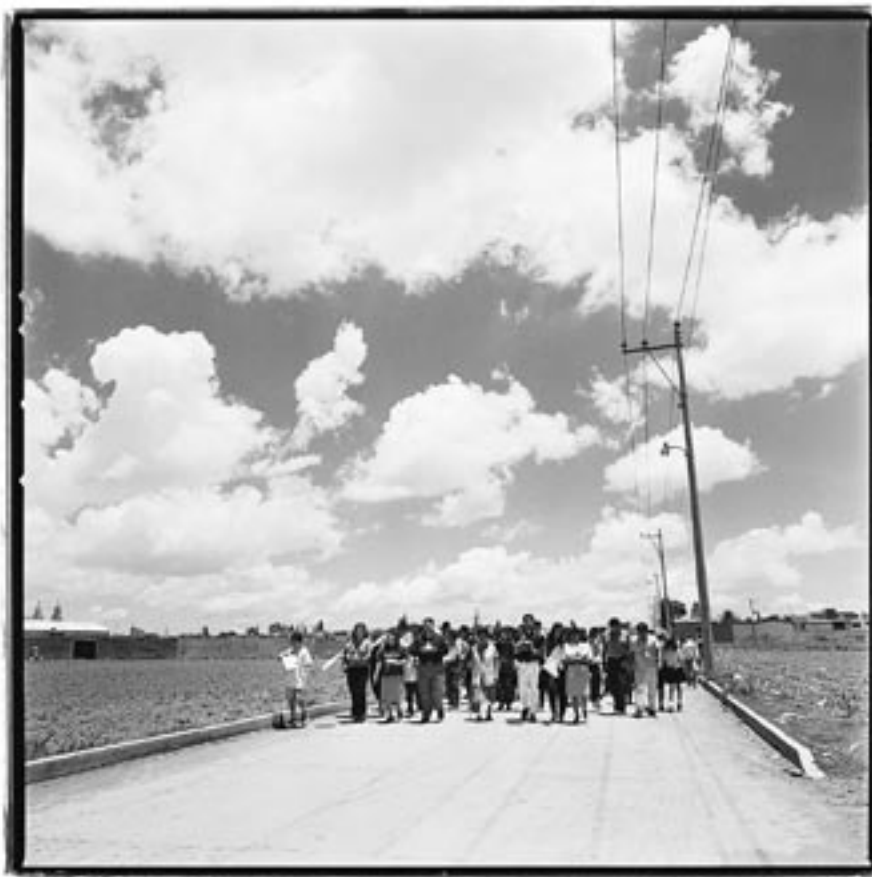
© John O'Leary, Barrio de San Juan Texpolco, Cholula, Puebla, 1999.

reconstrucción hipotética mientras que los datos arqueológicos y los de la tradición histórica requieren ampliarse y vincularse entre sí. Persiste en los estudios mesoamericanos en general –y en particular, en el de Cholula– una suerte de “esquizofrenia académica” (tal como lo señaló un historiador), debido a la cual el ámbito histórico no ha sido sujeto a un cotejo comparativo con el arqueológico. 2