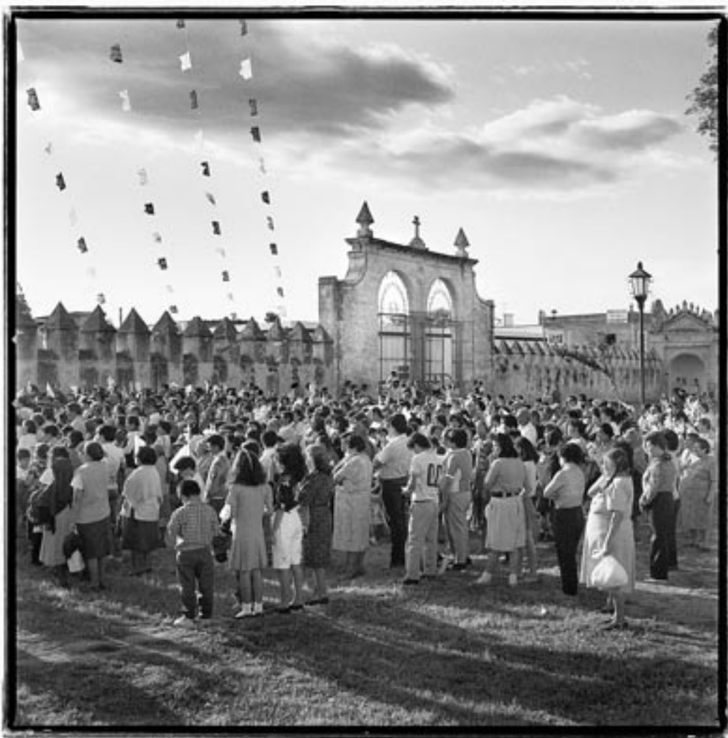
© John O'Leary, jueves de Corpus, Cholula, Puebla, 1992.