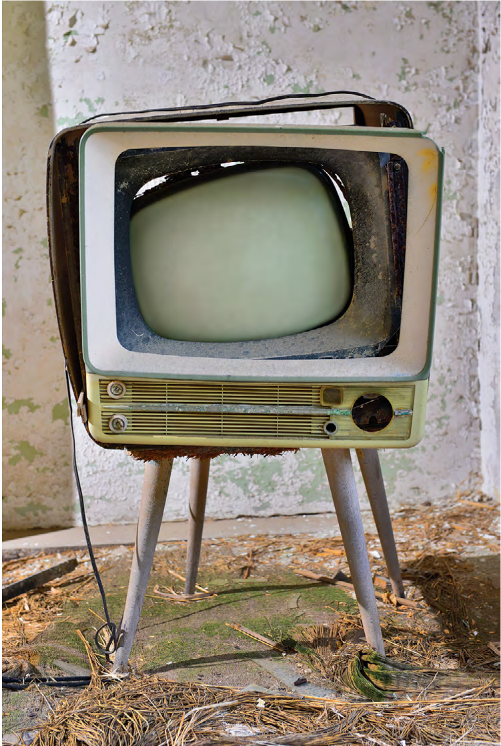
De la serie Ciudades Muertas, 2010-2014.