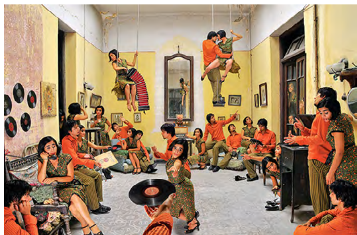
© Daniel Machado. Aquí esta su disco. De la serie Tango Con-fusion, 2010.

www.danielmachado.com www.danielmachado.com.uy tutangol@yahoo.com