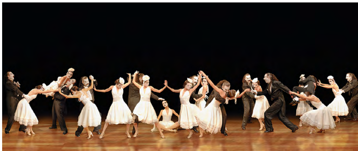
© Daniel Machado. El gran abrazo. De la serie Tango Con-fusion, 2007.

En este número de Elementos , Machado presenta imágenes de sus series Ongaku Lucky Hole, Streamline in red, Homeless de Shibuya, Ciudades Muertas, Tango Con-fusion, Piernas y Bandoneón y Los sueños de Natsu, donde nos muestra una extraña combinación de fiesta y hastío, música y silencio.